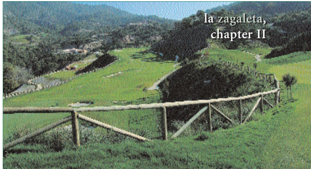
la zagaleta, chapter II

On the road to Ronda, Zagaleta is still there, just fifteen minutes from Marbella. The grand residences have multiplied without crowding together, with a sweeping view towards Gibraltar and the African coast. After all, 2,500 acres scarcely fill up like a council estate. With lots around 4,000 sq. yards, there's plenty of breathing space between each building occupied by the who's who of Europe and elsewhere. The houses are vast and often superb, some being handed over with the keys from two million euros upwards. So it's like being in a highly exclusive club whose members evidently have more than an euro to spare. The facilities are superb everything being laid on to simplify their life.